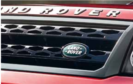
Grille in Gloss Black met twee lamellen in diamantpatroon.