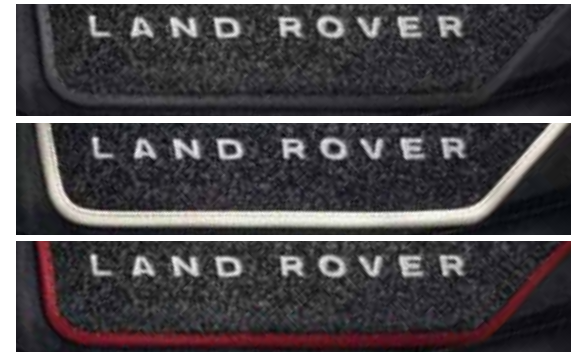
Premium matten met omboording in Ebony, Ivory of Pimento.