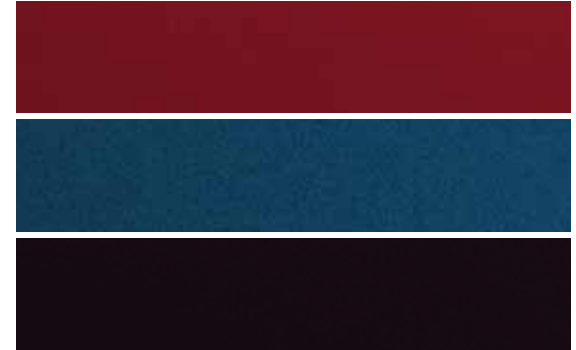
Lakkleuren: Rimini Red, Mauritius Blue, Barolo Black.