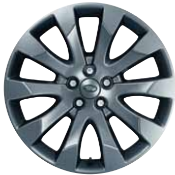
19" '10-Spoke' lichtmetalen velgen 'Styling 3' in Shadow Chrome.