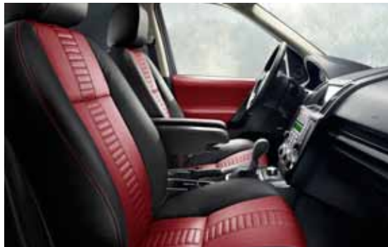
Generfd lederen stoelbekleding in Ebony met Pimento middenbaan.