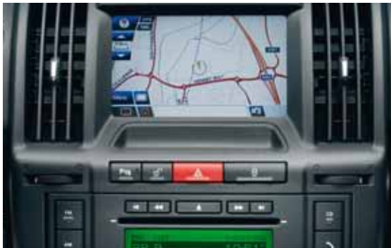
Premium DVD-navigatiesysteem met kleuren 'touch-screen'.