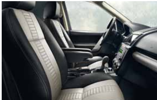
Generfd lederen stoelbekleding in Ebony met Ivory middenbaan.