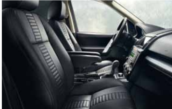
Generfd lederen stoelbekleding in Ebony met Ebony middenbaan.