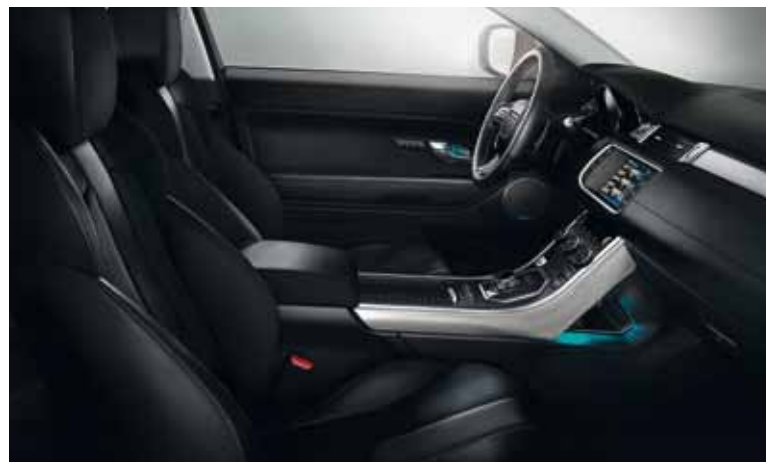
Range Rover Evoque Coupé Pure - Ebony generfd leder/Dynamica® stof.