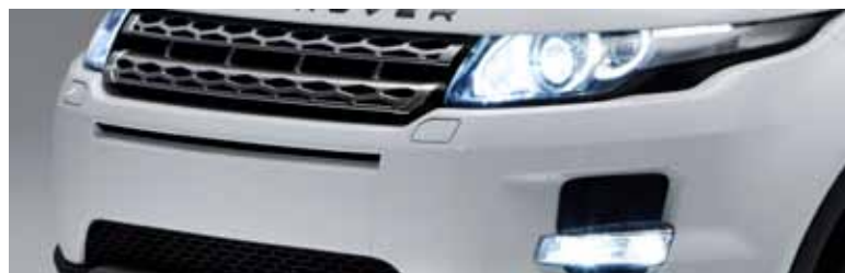
LED mistlampen en Xenon koplampen met LED 'signature'-verlichting en koplampsproeiers.