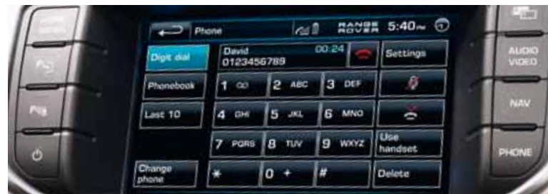
Pure Tech Pack: 8" kleuren TFT 'touch-screen' en Bluetooth™ mobiele telefoon-integratie.