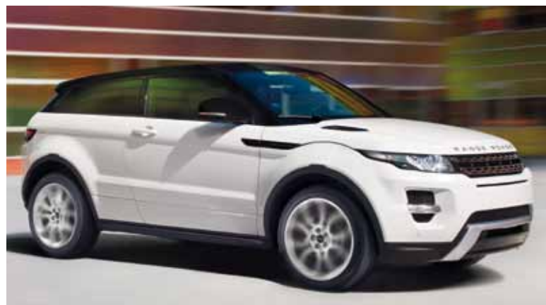
Range Rover Evoque Coupé Dynamic in Fuji White met contrastdak in Santorini Black.