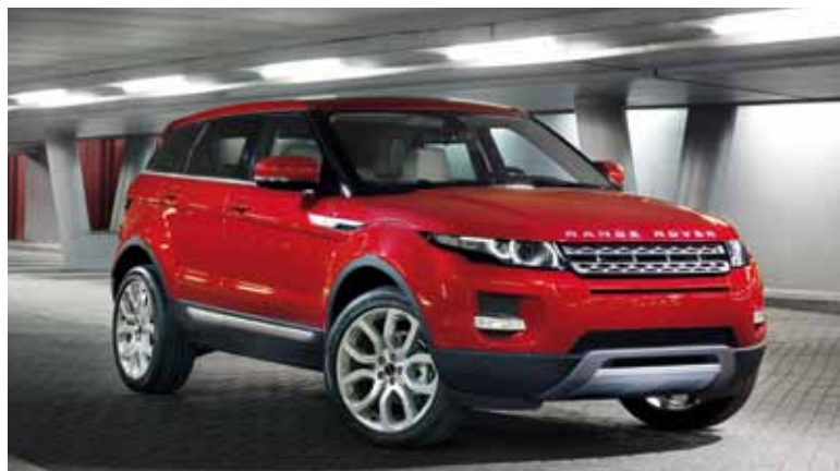
Range Rover Evoque Prestige in Firenze Red met 'Styling 6' velgen.