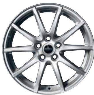
17-inch 'Styling 1' lichtmetalen velg.