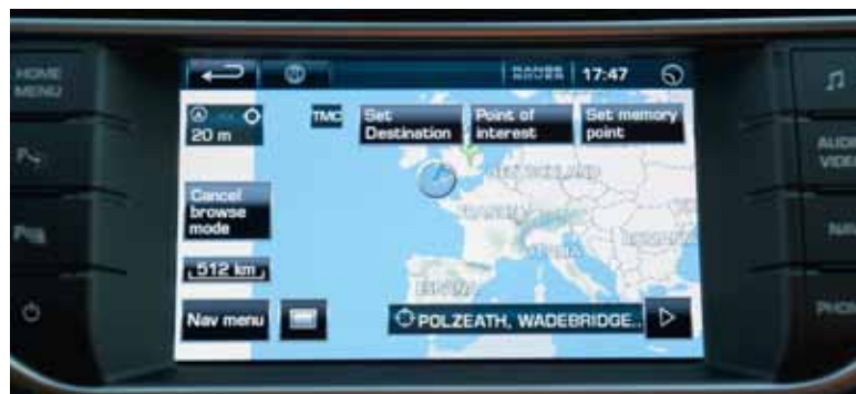
Harddrive satellietnavigatiesysteem met TMC-functie.