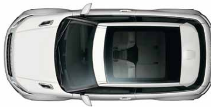
Glazen panoramadak met elektrisch bedienbare zonwering.