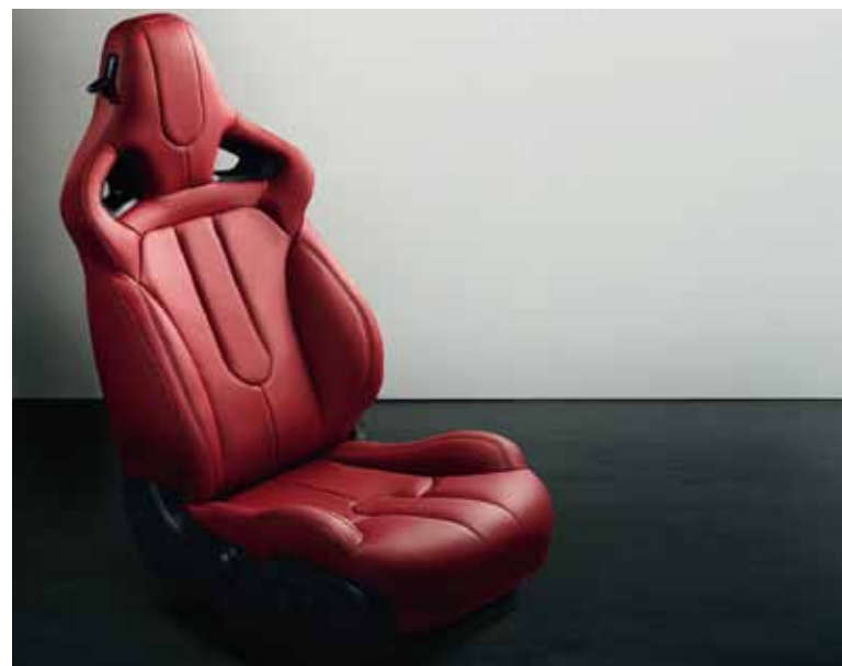
Dynamic Plus Pack: luxeuze sportstoelen in Oxford leder met geïntegreerde hoofdsteunen.