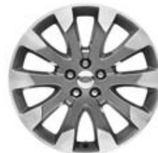
Jante en alliage de 19" à 10 rayons à laque contrastante en finition Diamond Turned - Style 2