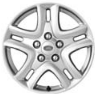
Jante en alliage de 16" à 5 rayons De série sur 'E'