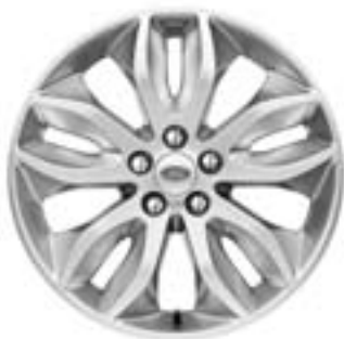
Jante en alliage de 18" à 10 rayons en finition Sparkle Silver De série sur 'HSE'