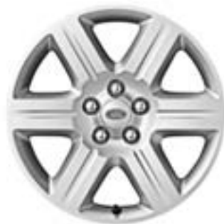
Jante en alliage de 17" à 6 rayons - Style 1 De série sur 'S'