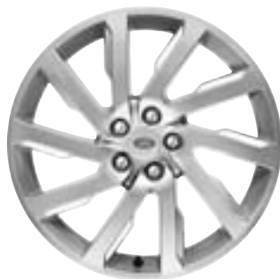
Jante en alliage de 19" à 10 rayons en finition Sparkle Silver - Style 1