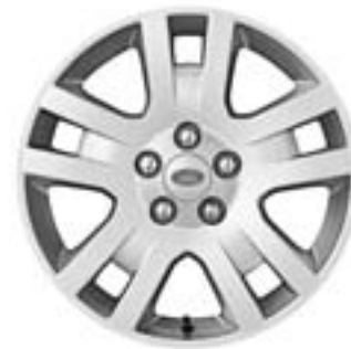
Jante en alliage de 17" à 5 doubles rayons - Style 2 De série sur 'SE'