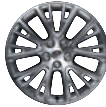
Style 17 : jantes en alliage 20" à 10 rayons en V en finition 'Decal Silver'