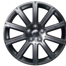
Style 12 : jantes en alliage 20" à 10 rayons avec rainure intégrée en finition 'Bright Polished' (un rayon à identification Range Rover)