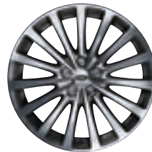
Style 19 : jantes en alliage 20" à 15 rayons en finition contrastante 'Diamond Turned'