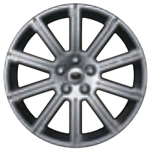
Style 11 : jantes en alliage 20" à 10 rayons avec rainure intégrée à finition 'Sparkle Silver' (un rayon avec identification Range Rover)