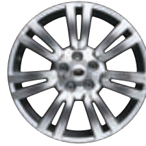
Style 9 : jantes en alliage 20" à 7 rayons en V en finition 'Sparkle Silver' (un rayon à identification Range Rover)