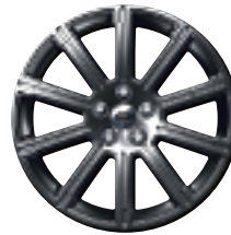
Style 12 : jantes en alliage 20" à 10 rayons avec rainure intégrée en finition 'Bright Polished' (un rayon à identification Range Rover)