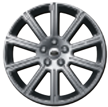
Style 11 : jantes en alliage 20" à 10 rayons avec rainure intégrée à finition 'Sparkle Silver' (un rayon avec identification Range Rover)