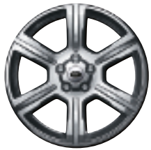
Style 14 : jantes en alliage 20" à 6 rayons avec rainure intégrée en finition 'Diamond Turned'