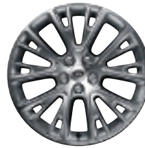
Style 17 : jantes en alliage 20" à 10 rayons en V en finition 'Decal Silver'