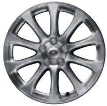
Style 15 : jantes en alliage 19" à 10 rayons