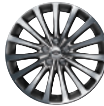
Style 19 : jantes en alliage 20" à 15 rayons en finition contrastante 'Diamond Turned'