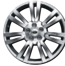
Style 9 : jantes en alliage 20" à 7 rayons en V en finition 'Sparkle Silver' (un rayon à identification Range Rover)