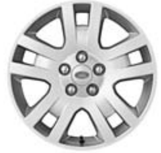
Jante en alliage de 17" à 5 doubles rayons - Style 2 De série sur 'SE'