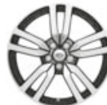
Jantes en alliage 20" à 5 rayons en V et finition intérieure 'Gloss Black'