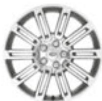
Jantes en alliage 20" à 10 doubles rayons