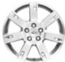
Jantes en alliage 19" à 7 rayons