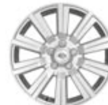
Jantes en alliage 19" à 10 rayons