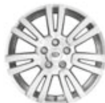
Jantes en alliage 19" à 7 double rayons